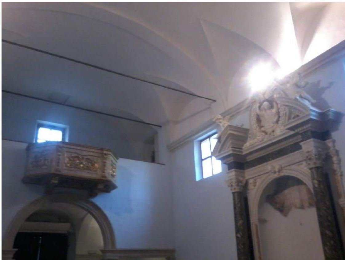
Soffitto con tiranti di ferro (da cui è possibile far calare elementi non eccessivamente pesanti)