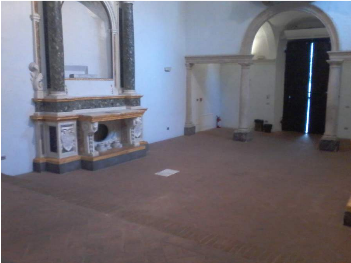
Ingresso e altare laterale